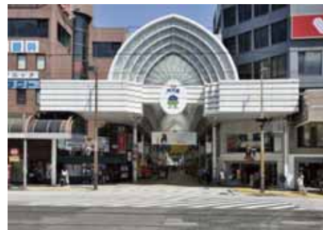
天文館アーケード

天文館アーケードまで徒歩5分。飲食店やファッションビルが集い、繁華街はアーケードが続くため雨の日のショッピング時も安心。