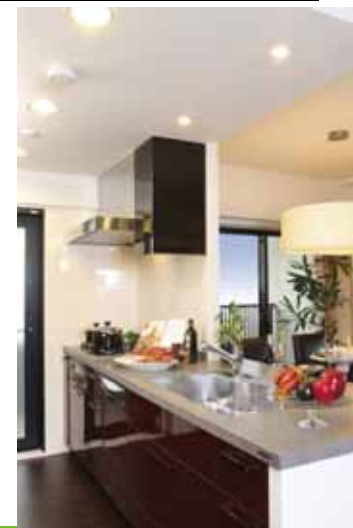
スライド式食器洗い乾燥機