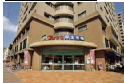
フレッセ厚生市場

夜10時まで営業。新鮮な野菜や精肉・鮮魚が住民の方にも好評。焼きたてのパン、総菜バイキングも人気