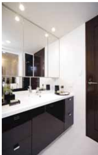
三面鏡付洗面化粧台

ワイドなシンクで洗髪も可能、洗面台横のリネン庫も収容量が豊富、足元には体重計等を収納でき使い勝手が良い