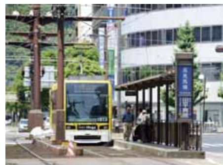
市電「高見馬場電停」徒歩5分

鹿児島駅・鹿児島中央駅・谷山方面までアクセスが可能な鹿児島市電。市電だけでなく高見馬場バス停からは鹿児島市内各地へのバス停もあるため便利。