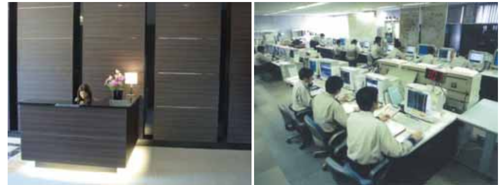
入居後も安心して過ごせる管理体制が魅力